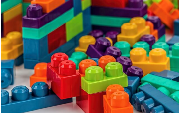
Das molekulare Zustellsystem von Cutanos ist modulartig aufgebaut, vergleichbar mit Legobausteinen

Open Science > Medizin - Mensch - Ernährung > Wiener Start-up Cutanos: „Molekularer Zustelldienst“ für neue Immuntherapien